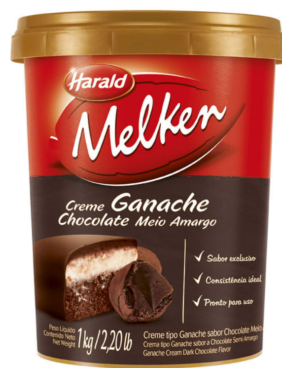
GANACHE MEIO AMARGO MELKEN 1 KG cód 166