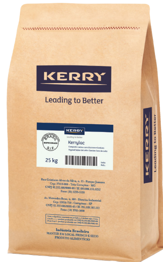
Kerrylac 800i cód 120