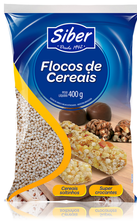
FLOCOS DE ARROZ 400 G cód 37