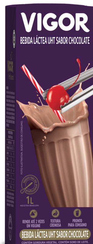
BEBIDA LÁCTEA VIGOR CHOCOLATE cód 289