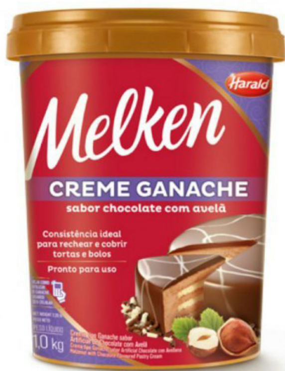
GANACHE AVELÃ MELKEN 1 KG cód 167