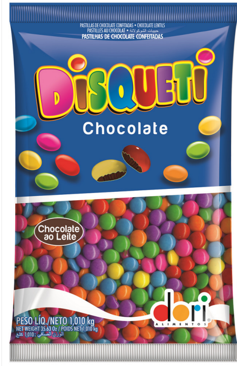
DISQUETE CHOCOLATE • 1,010 KG cód 95