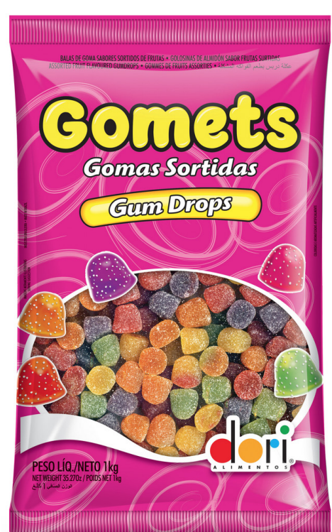
GOMETS GOMA SINO 1 KG cód 93