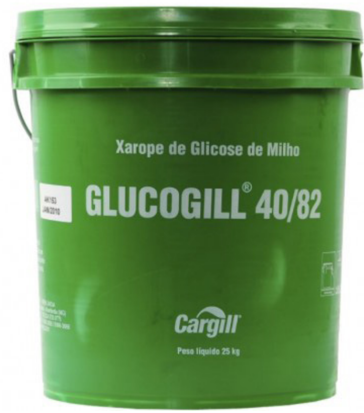
GLUCOGILL 40/82 25 KG cód 34