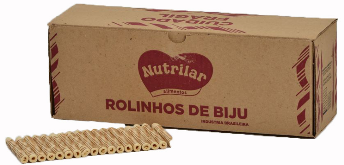
ROLINHO BIJU cód 279