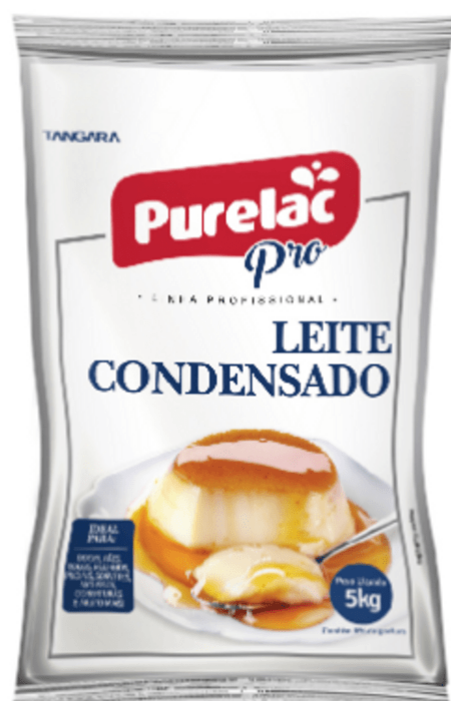
LEITE CONDENSADO PURELAC 5 KG cód 282