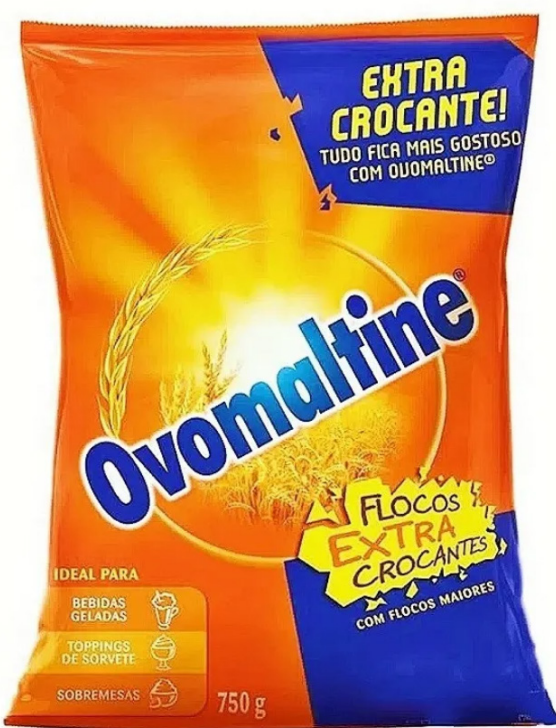
FLOCOS CROCANTES OVOMALTINE 750 G cód 118