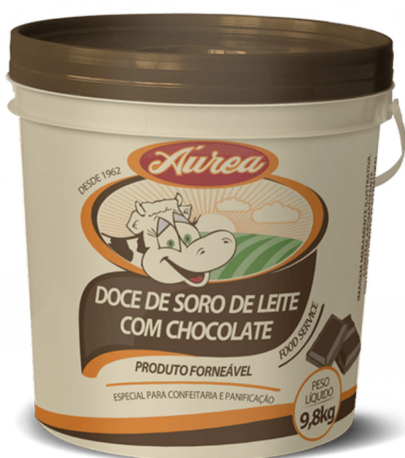
DOCE DE SORO DE LEITE COM CHOC. 9,8KG cód 04