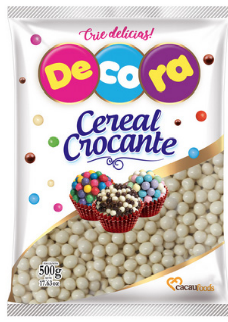
BIG CEREAL CHOC. BRANCO 500 G cód 273