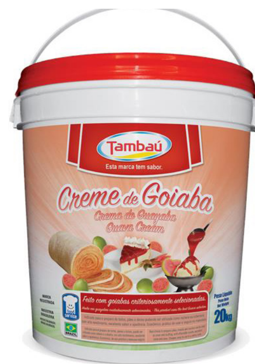
CREME DE GOIABA 4,8 KG cód 97