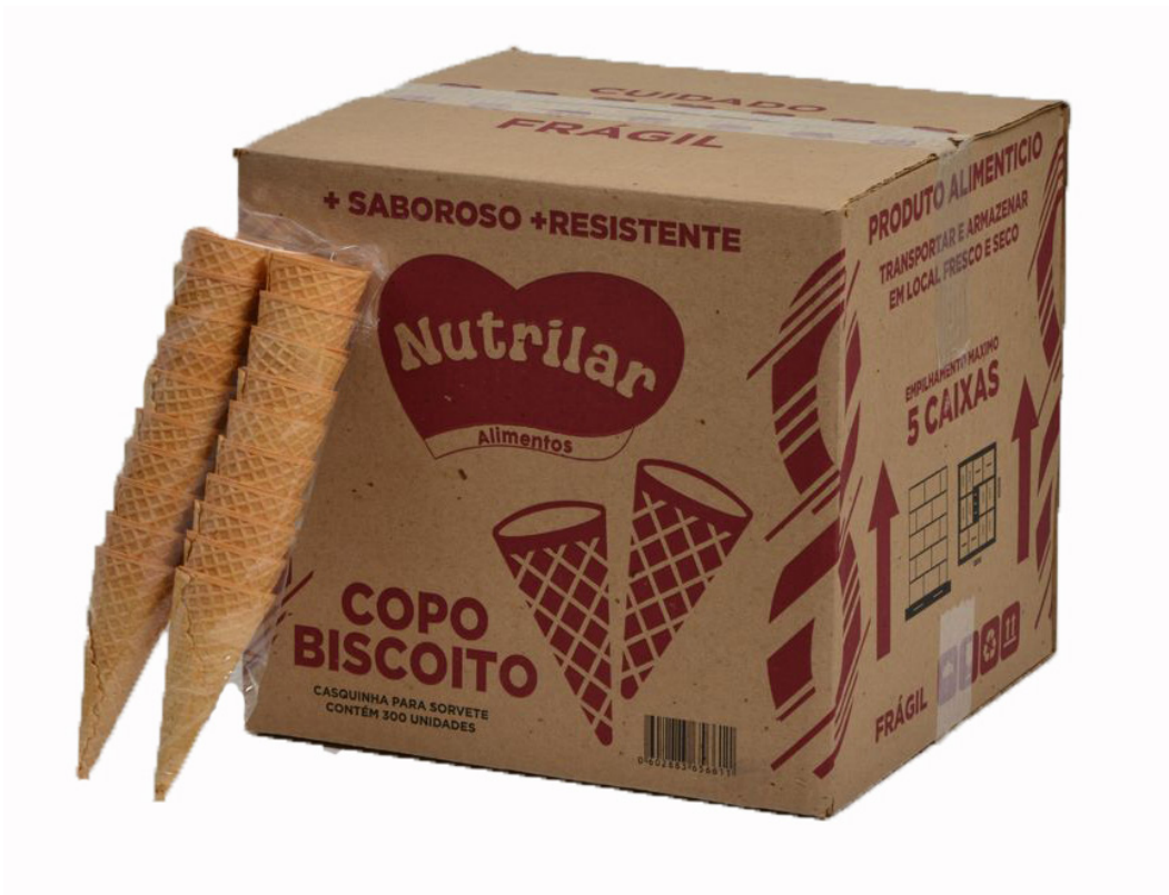
COPO BISCOITO cód 290