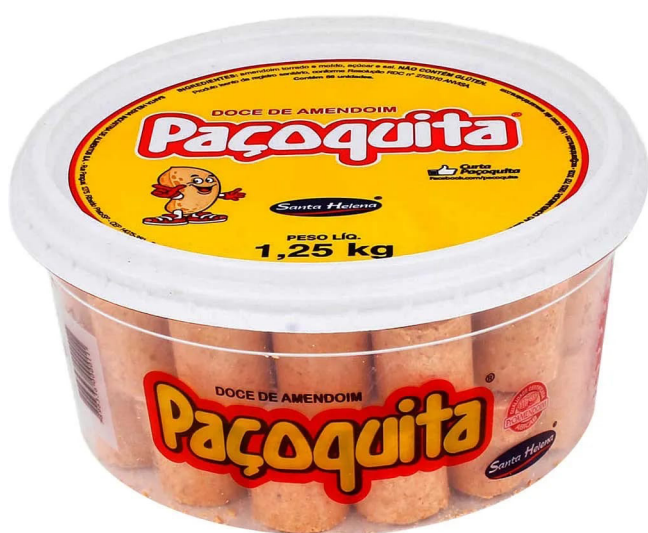
PAÇOQUINHA ROLHA POTE 1,25 KG cód 96