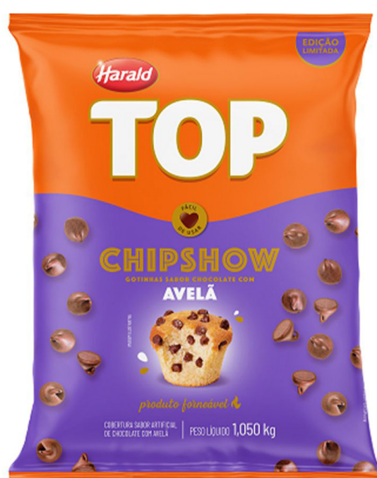
COB. CHIPSHOW AVELÃ TOP 1,050 KG cód 168