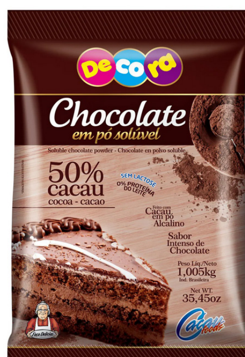
CHOCOLATE EM PÓ SOLÚVEL 50% CACAU cód 124