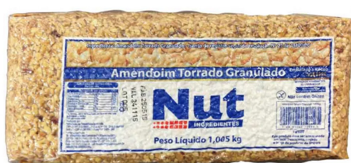
AMENDOIM GRANULADOS NUT cód 287