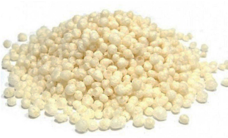
FLOCOS DE ARROZ A GRANEL cód 110