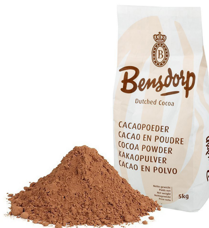
CACAU PROCESSADO BENDSORP BARRY 5 KG cód 125