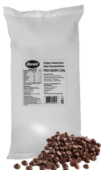
COBERTURA CHIPSHOW CHOCOLATE AO LEITE 2,5 KG cód 06