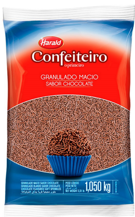
GRANULADO ESC HARALD MACIO • 1,050 KG .....cód 14 CROCANTE • 1,050 KG... cód 121