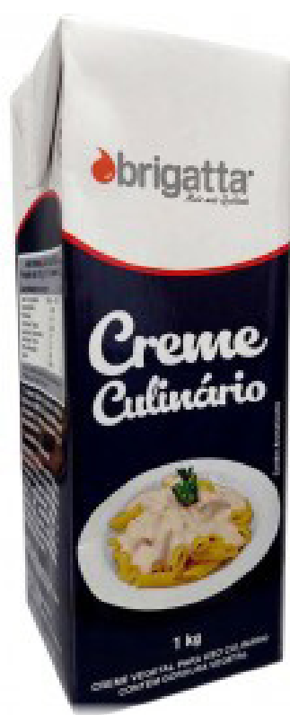
CREME CULINÁRIO BRIGATTA cód 282