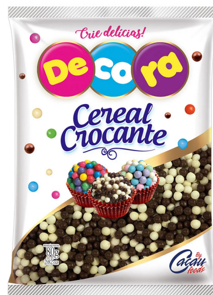
MINI CEREAL CROCANTE M BRANCO/PRETO 500 G cód 122