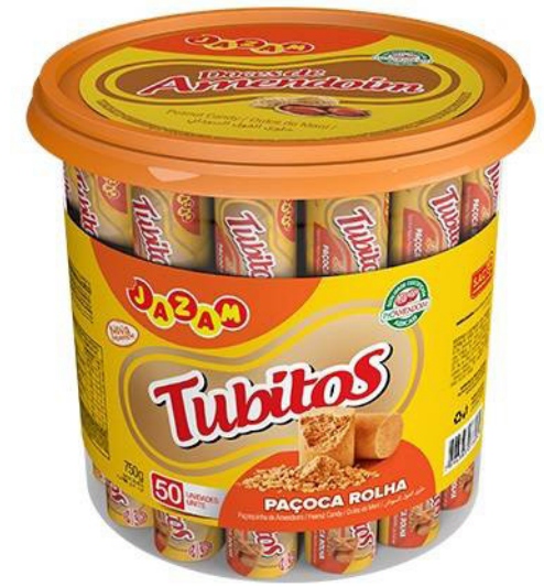
PAÇOQUINHA TUBITOS POTE 750 G cód 178