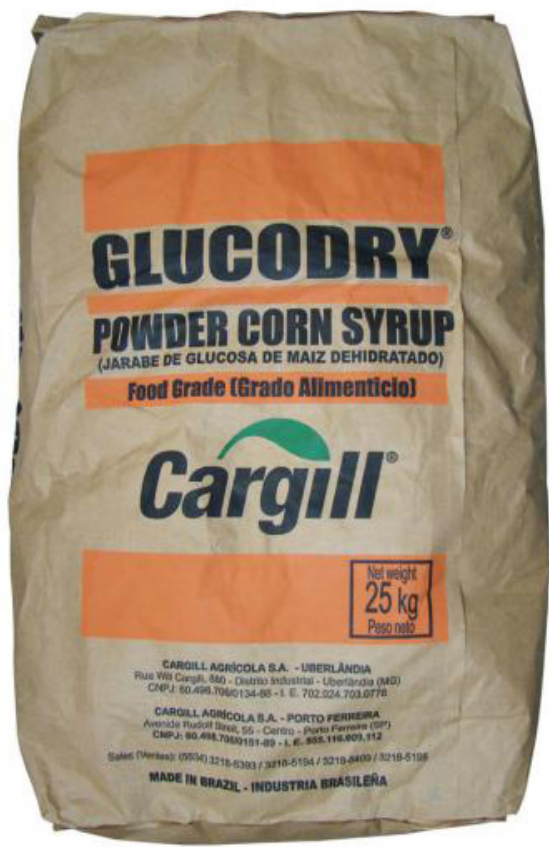
GLUCODRY 40 25 KG cód 33