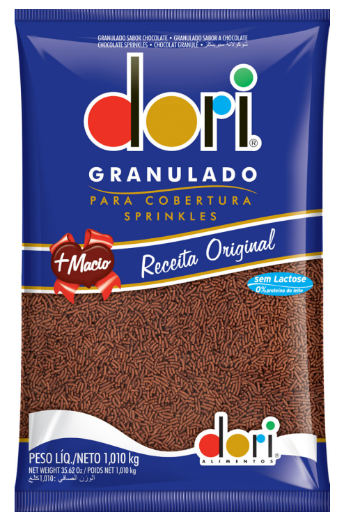
GRANULADO CHOCOLATE DORI • 1,010 KG cód 173