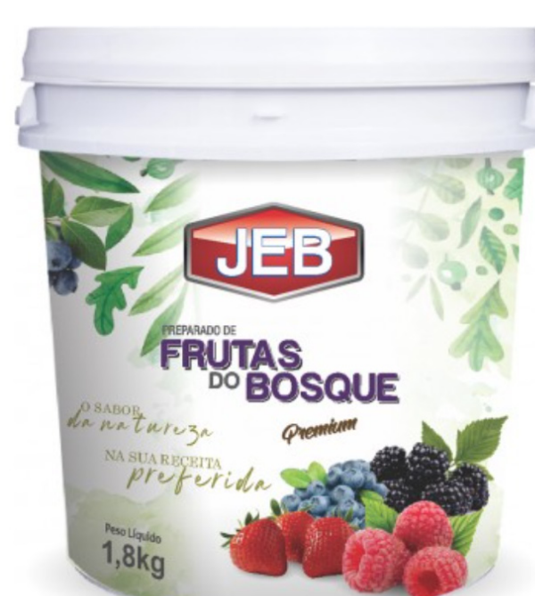
FRAMBOESA 1,8 KG..... FRUTAS DO BOSQUE 1,8 KG.....