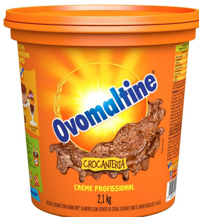
OVOMALTINE CREME CROCANTE 2,10 KG