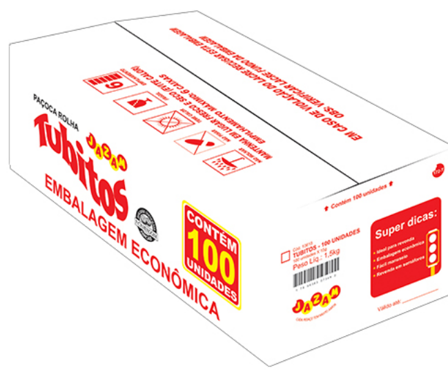
PAÇOQUINHA TUBITOS CAIXA cód 176