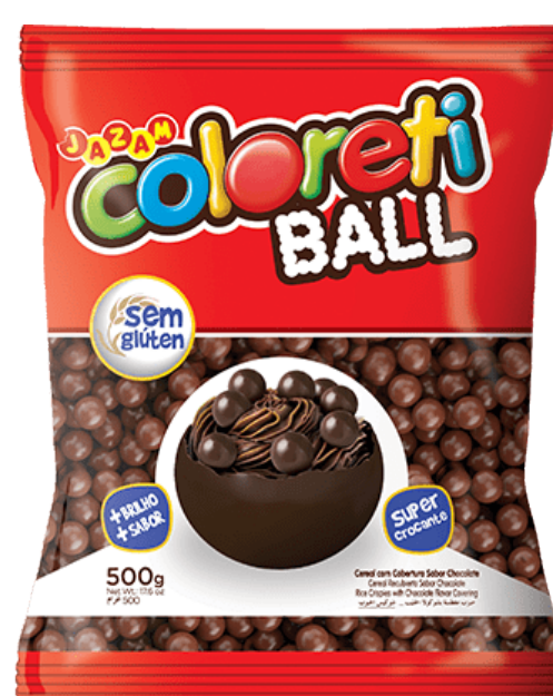
COLORETI BALL 500 G cód 179