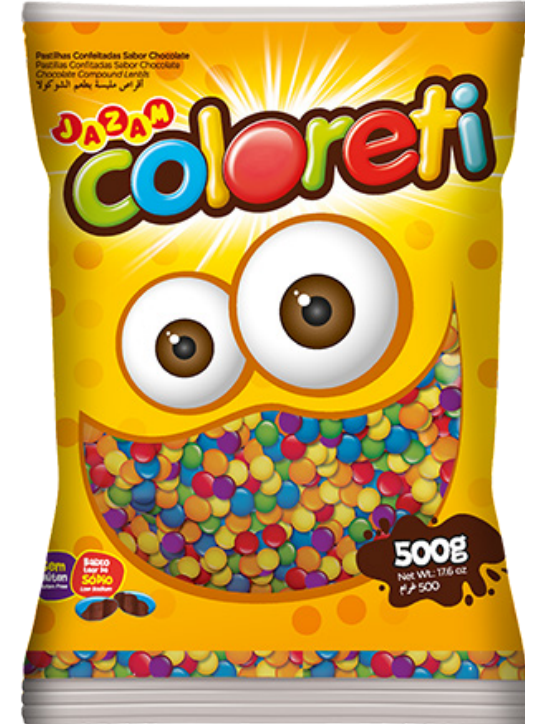
COLORETI MINI SORTIDO • 500G cód 175