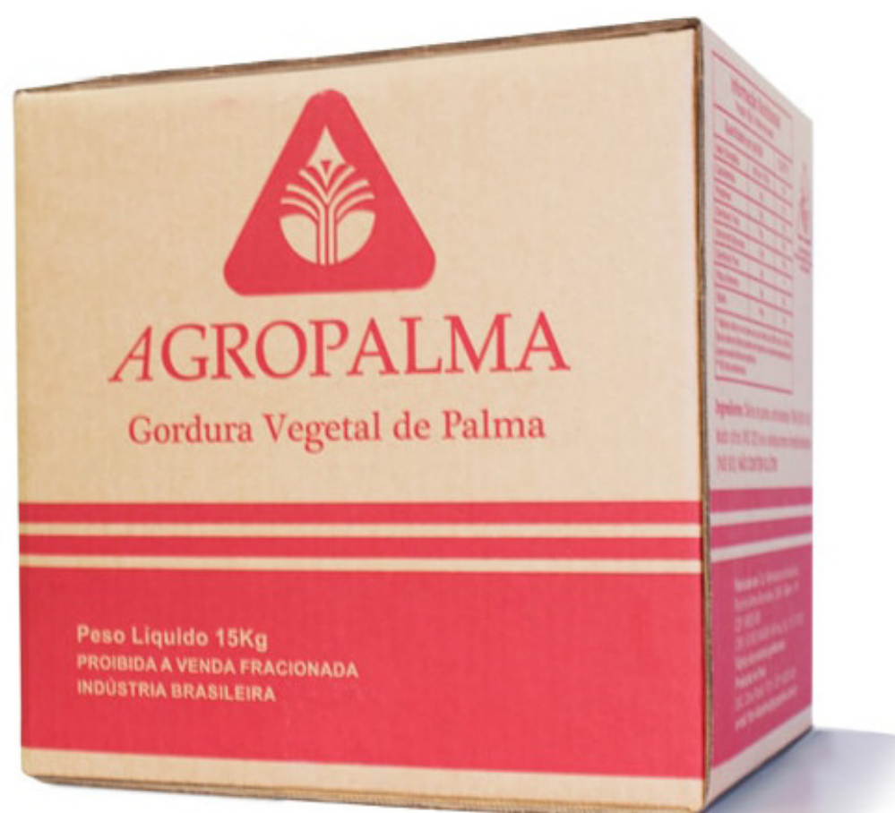
OLEO DE PALMISTE REFINADO CAIXA cód 03