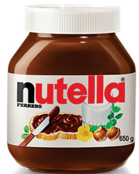
NUTELLA COM AVELÃ 650 G cód 172