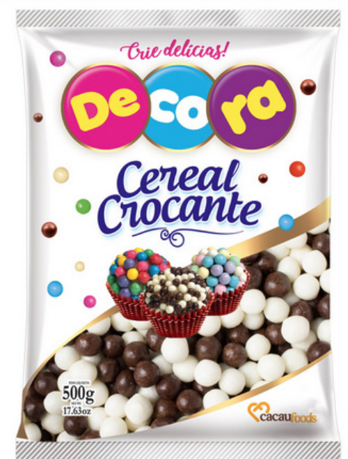
BIG CEREAL BRANCO/PRETO 500 G cód 293