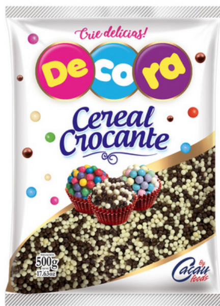
MINI CEREAL CROCANTE P BRANCO/PRETO 500 G cód 292