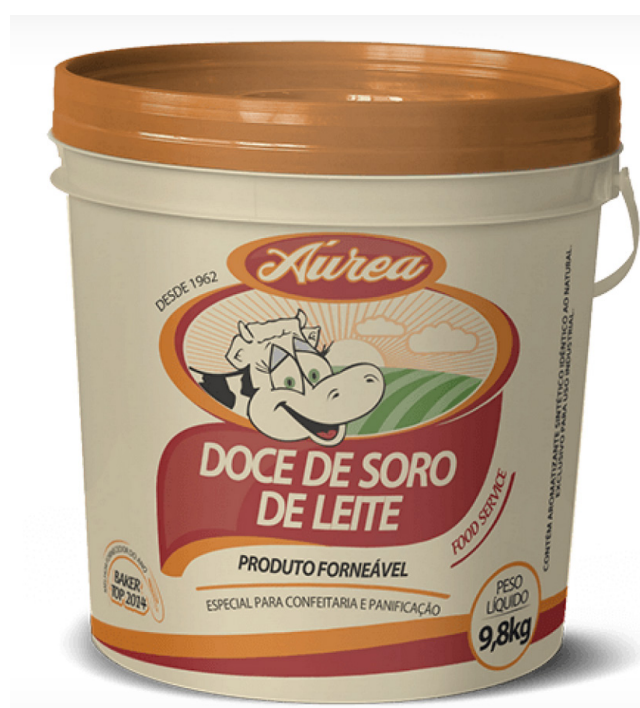
DOCE DE SORO DE LEITE TRADICIONAL 4,8 KG cód 09