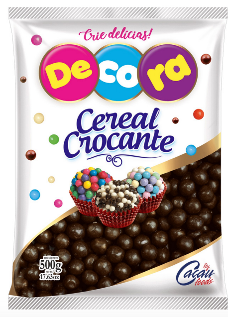
BIG CEREAL CROCANTE CHOCOLATE 500 G cód 123