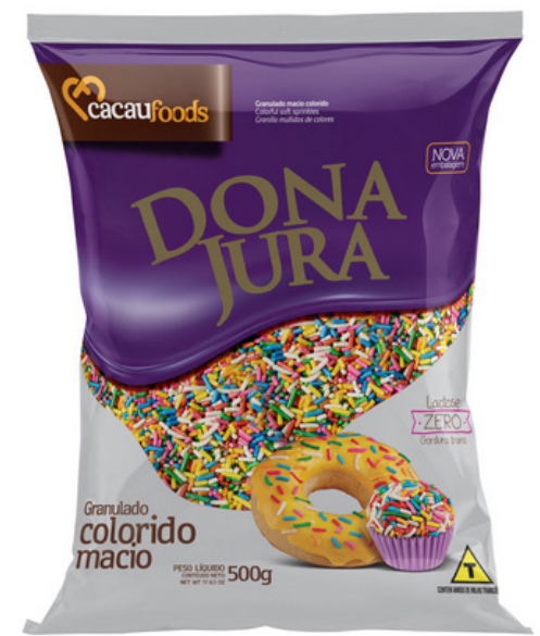
GRANULADO MACIO COLORIDO cód 291