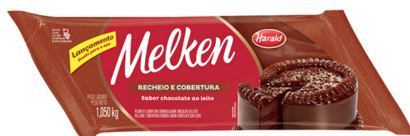
RECHEIO COBERTURA CHOCOLATE • 1,05 KG cód 276