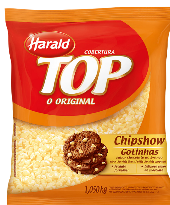
COB. CHIPSHOW BRANCO TOP 1,050 KG cód 169