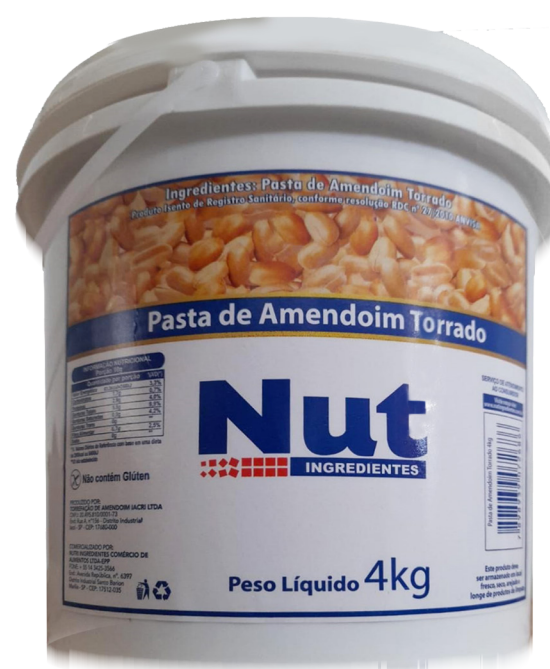
PASTA DE AMENDOIM NUT • 4KG cód 286