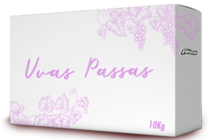
UVA PASSA CAIXA 10 KG cód 163