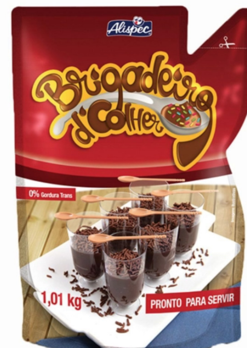
BRIGADEIRO DE COLHER ALISPEC • 1 KG cód 266