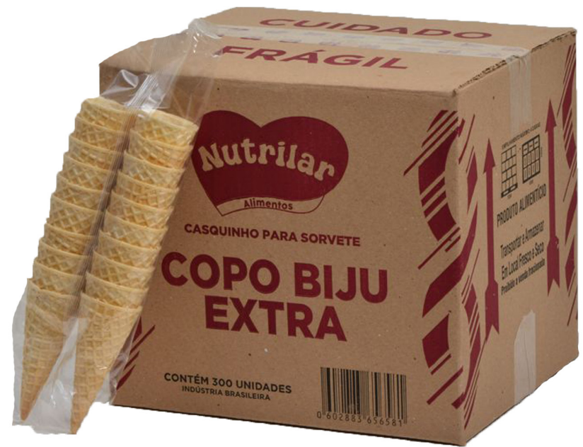
COPO BIJU cód 262