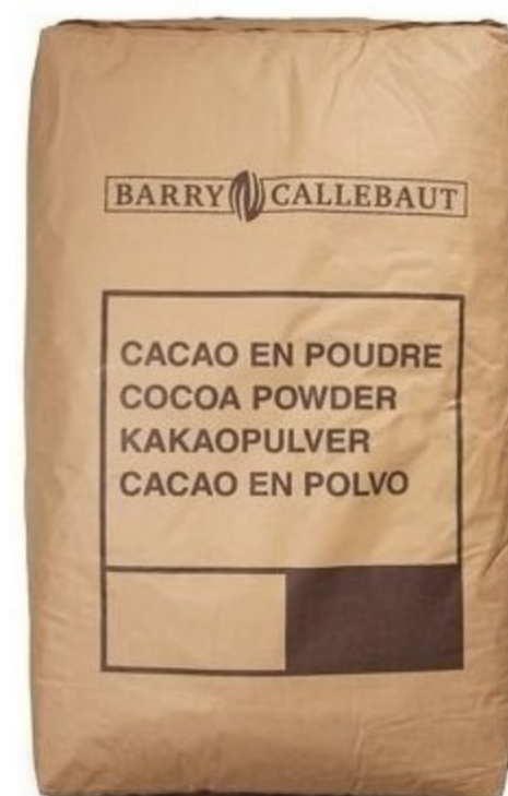
CACAU EM PÓ ALCALINO BARRY 25 KG cód 05