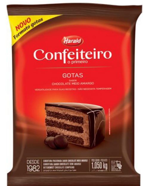
COB GTS MEIO AMARGO 1,050 KG cód 161