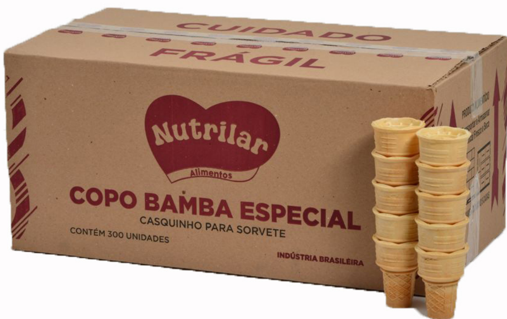
COPO BAMBÁ ESPECIAL cód 261