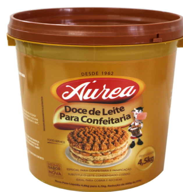
DOCE DE LEITE PARA CONFEITARIA AUREA 4,5 KG cód 154