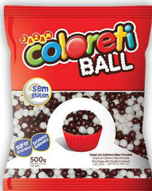
COLORETI MINI BALL MISTO 500 G cód 177