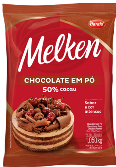
CHOCOLATE EM PÓ MELKEN 50% 1,050 KG cód 15