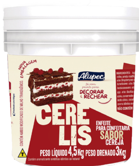
CERELIS BD 4,5 KG ..... cód 32 2,5 KG ..... cód 142