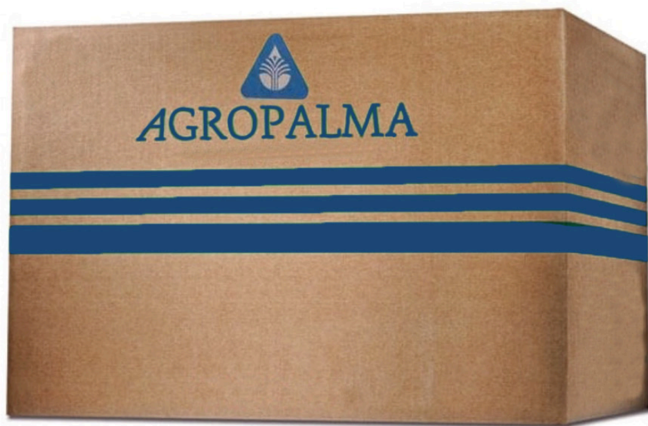
GORDURA DE PALMA 370B cód 257