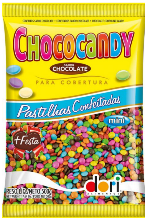
CHOCOCANDY PASTILHA COLORIDA 500 G cód 94