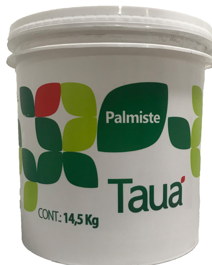
OLEO DE PALMISTE REFINADO BALDE cód 117