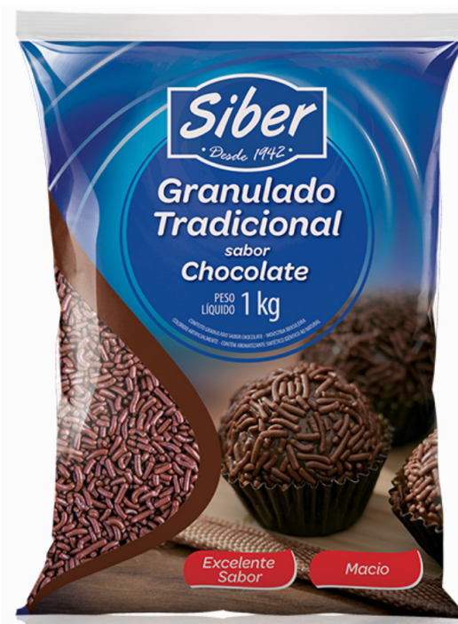
GRANULADO TRDCIONAL KERRY • 1 KG cód 98