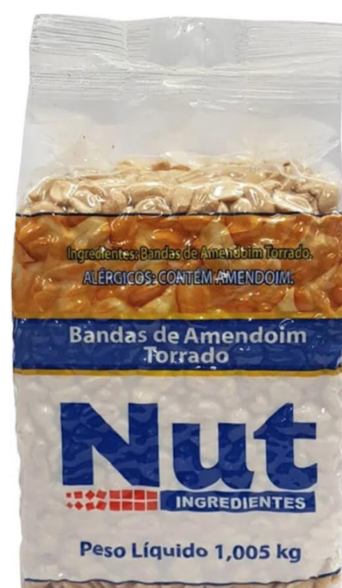
AMENDOIM BANDA NUT • 1KG cód 288