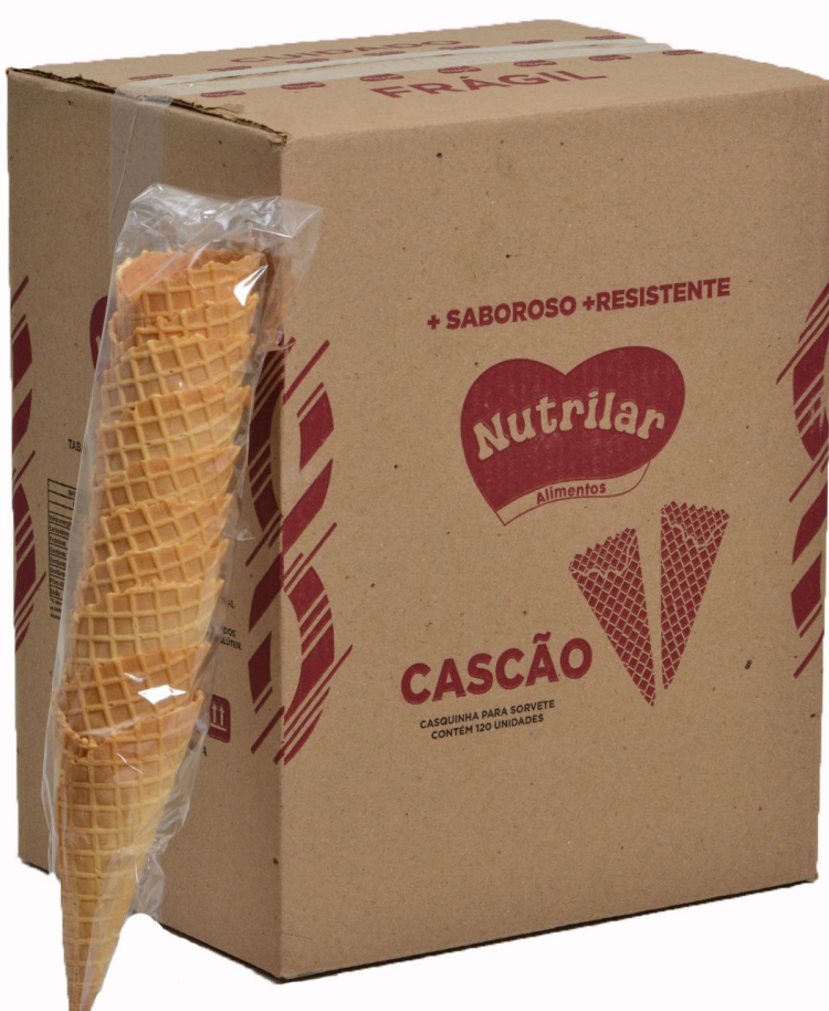
CASCÃO cód 283