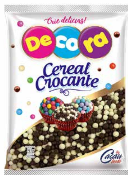
MINI CEREAL CROCANTE BRANCO/PRETO 500 G cód 122