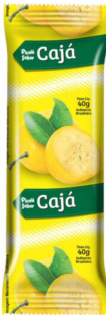
CAJÁ cód 61