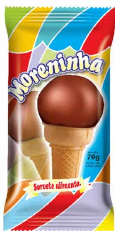
TRADICIONAL cód 73