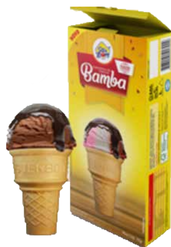
CASQUINHA BAMBA CX 300 cód 140