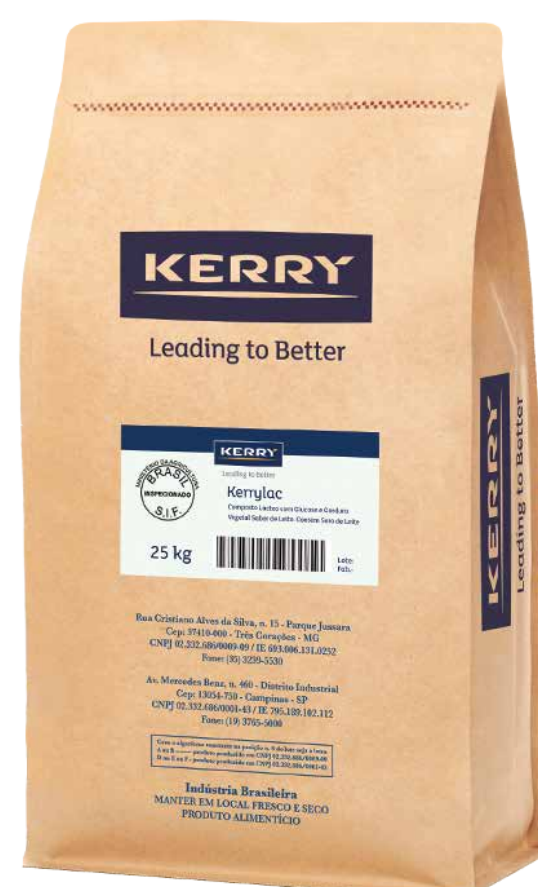
Kerrylac 800i cód 120