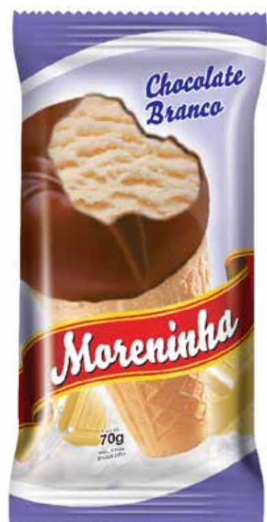
CHOCOLATE BRANCO cód 76