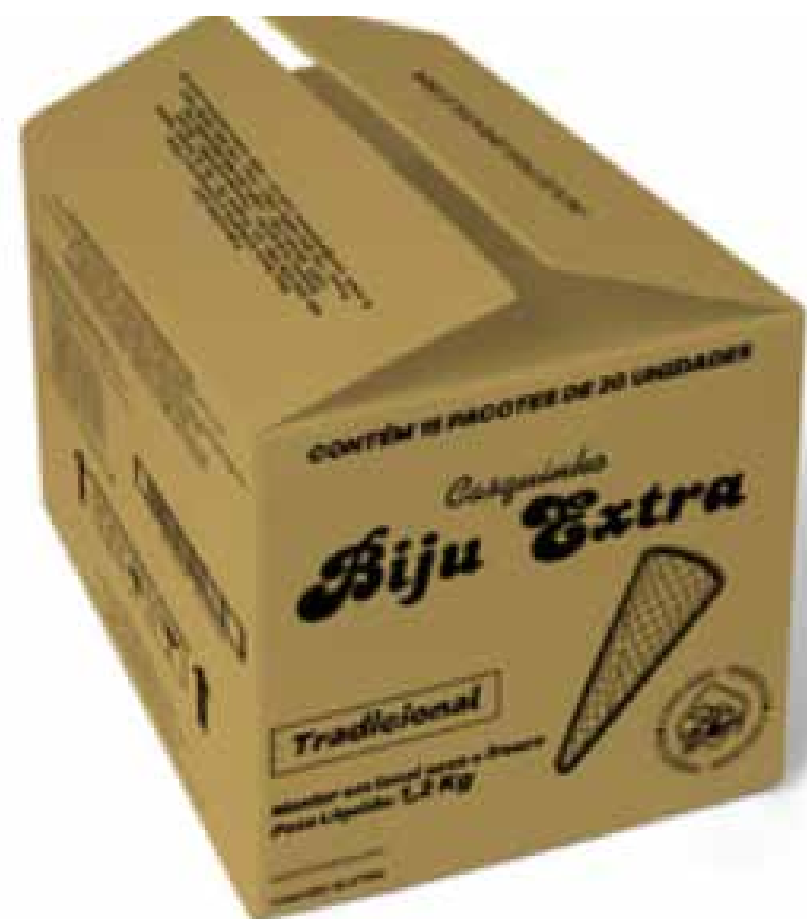
CASQUINHA BIJU EXTRA CX 300 UND cód 137