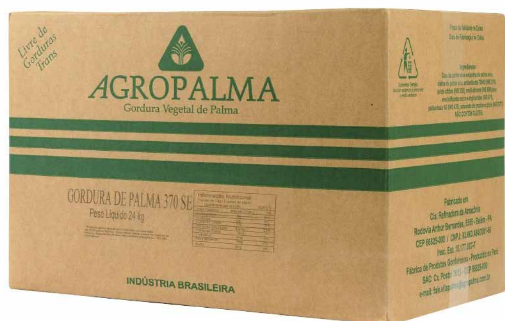
GORDURA DE PALMA 370B cód 16