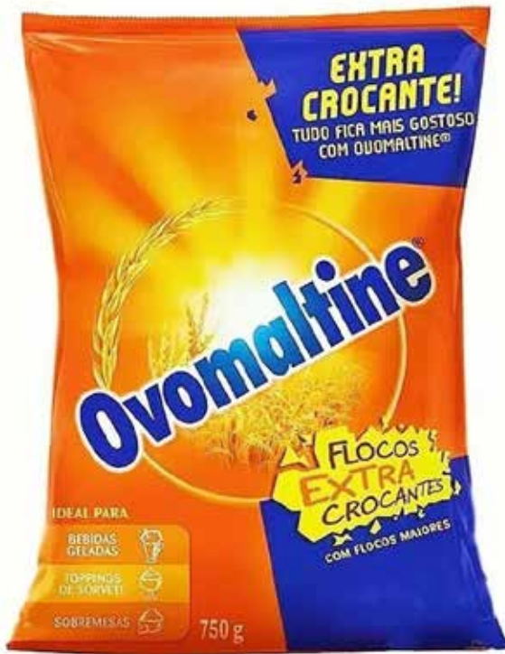
FLOCOS CROCANTES OVOMALTINE 750 G cód 118