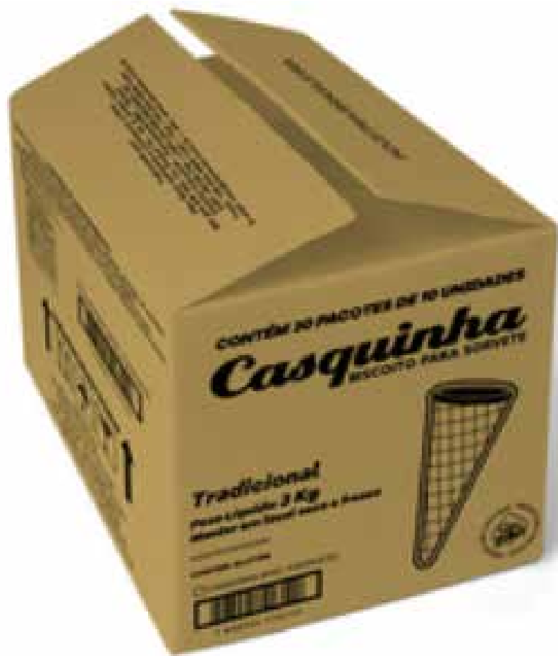
CASQUINHA BISCOITO CX 300 UND cód 138