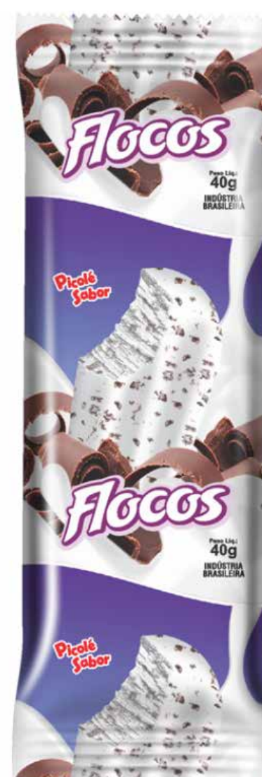
FLOCOS cód 66