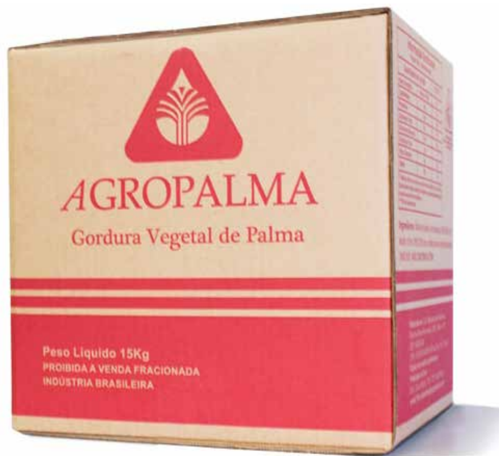
OLEO DE PALMISTE REFINADO CAIXA cód 03