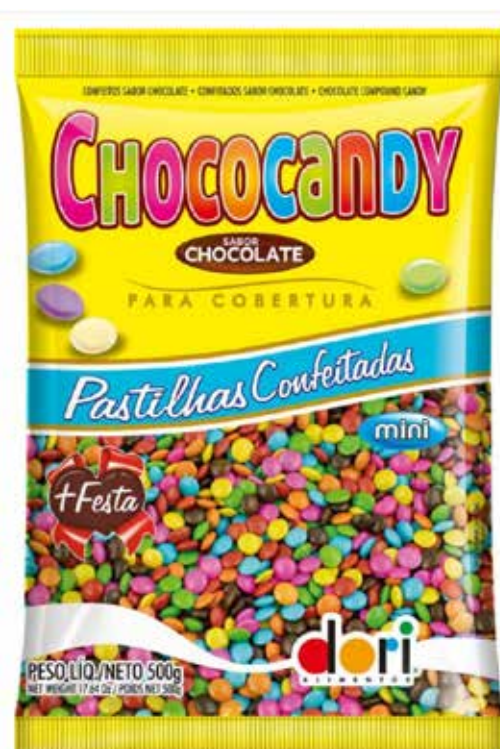
CHOCOCANDY PASTILHA COLORIDA 500 G cód 94