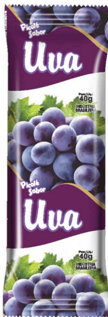
UVA cód 72