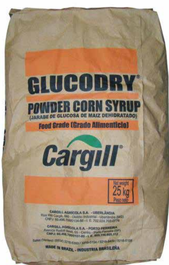
GLUCODRY 40 25 KG cód 33