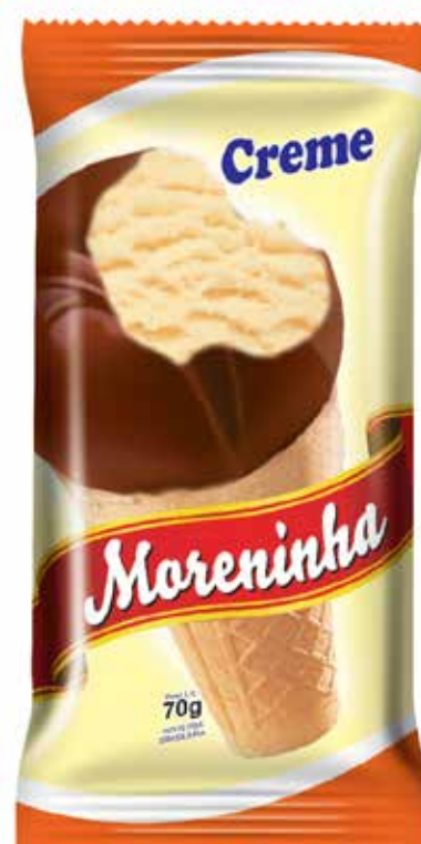
CREME cód 81