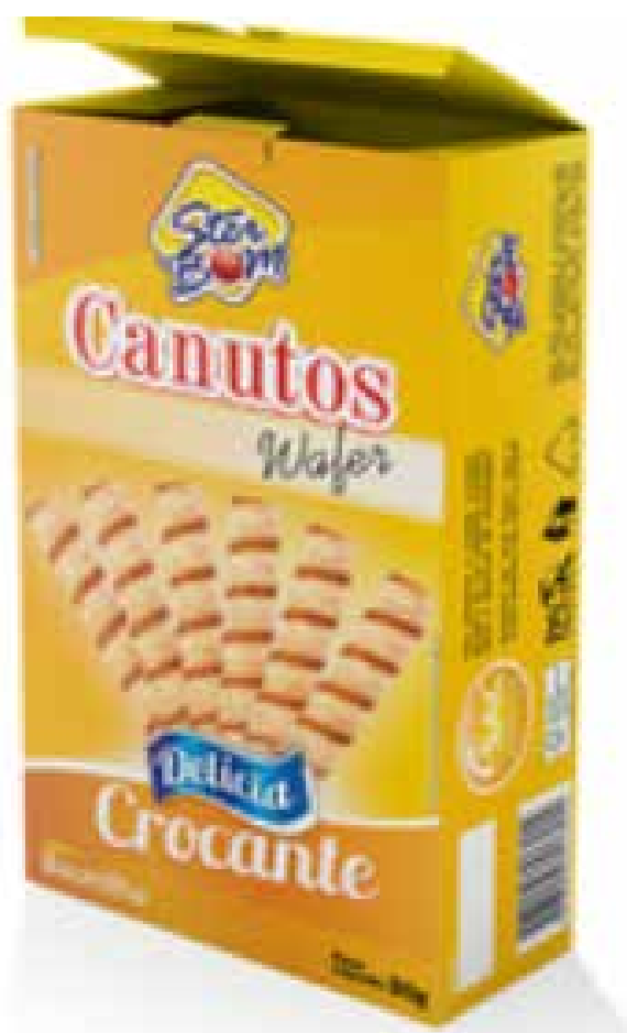
CANUTOS 1KG cód 136