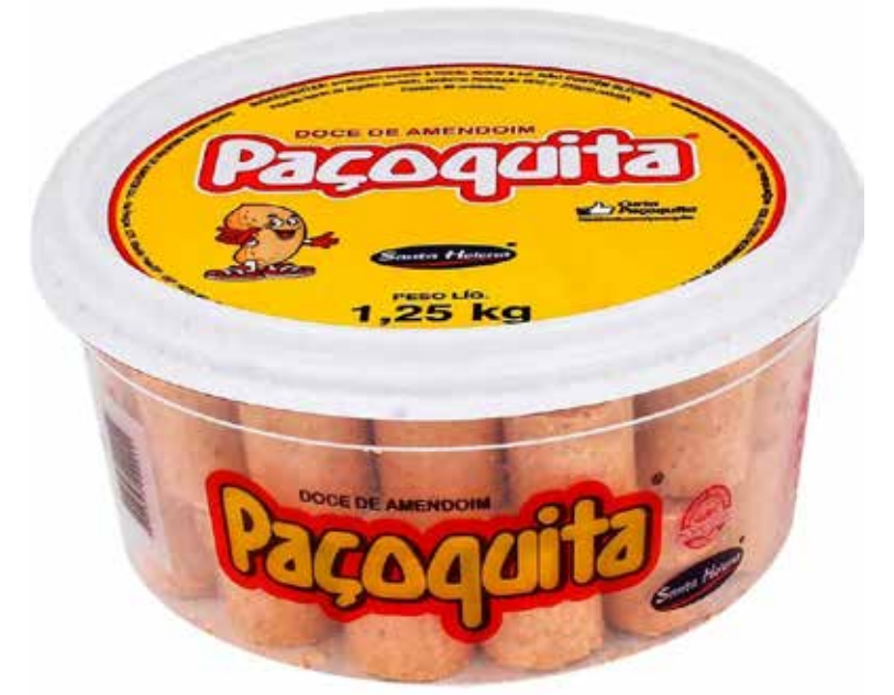
PAÇOQUINHA ROLHA POTE 1,25 KG cód 96