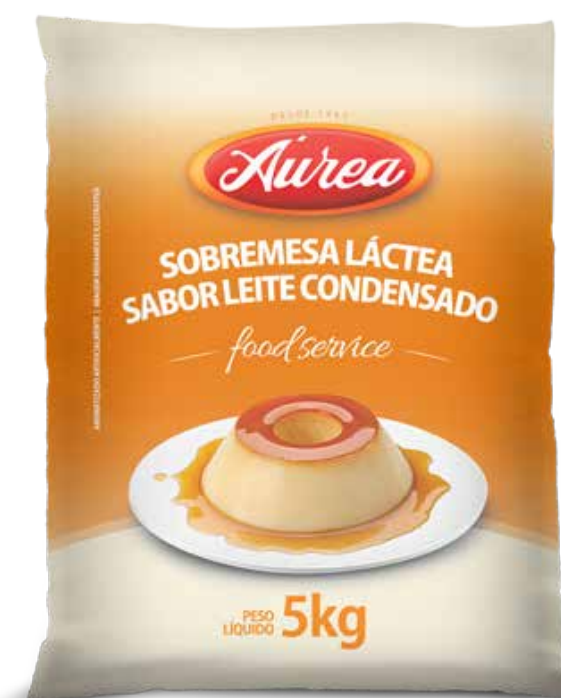
SOBREMESA LÁCTEA LEITE CONDENSADO AUREA 5KG cód 126