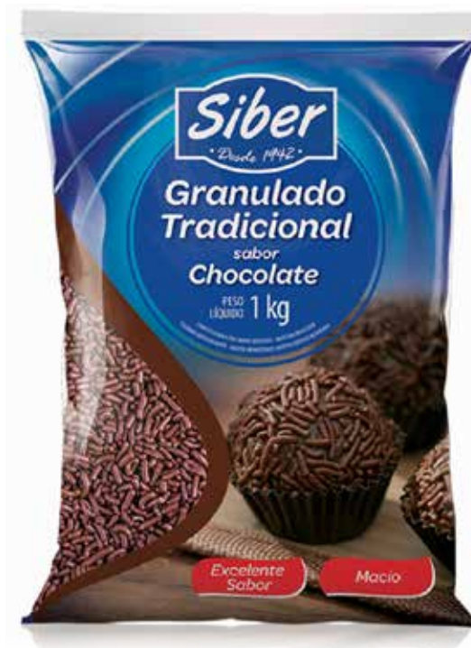
GRANULADO TRDCIONAL KERRY 1 KG cód 98