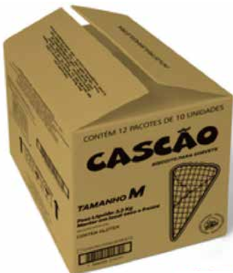
CASCÃO MÉDIO CX 120 cód 143