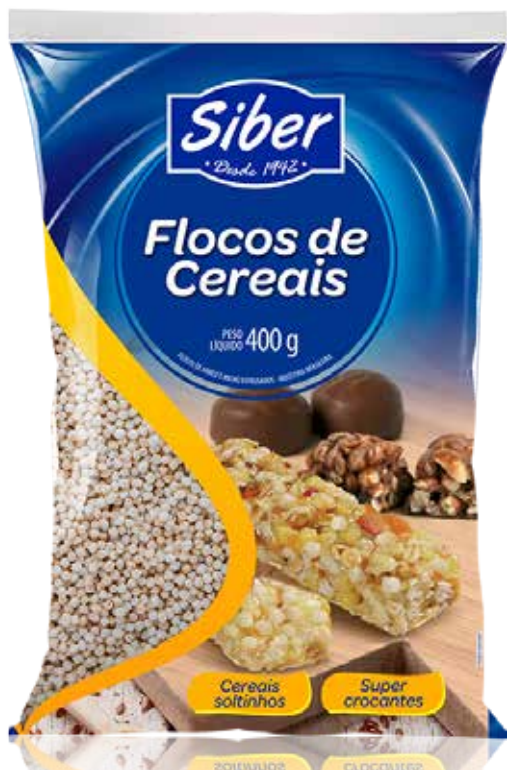
FLOCOS DE ARROZ 400 G cód 37