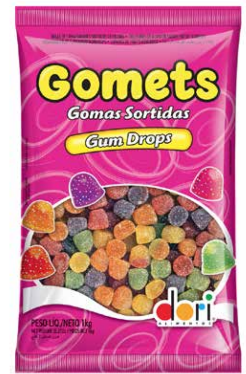
GOMETS GOMA SINO 1 KG cód 93