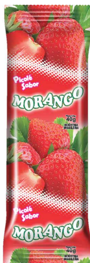
MORANGO cód 70