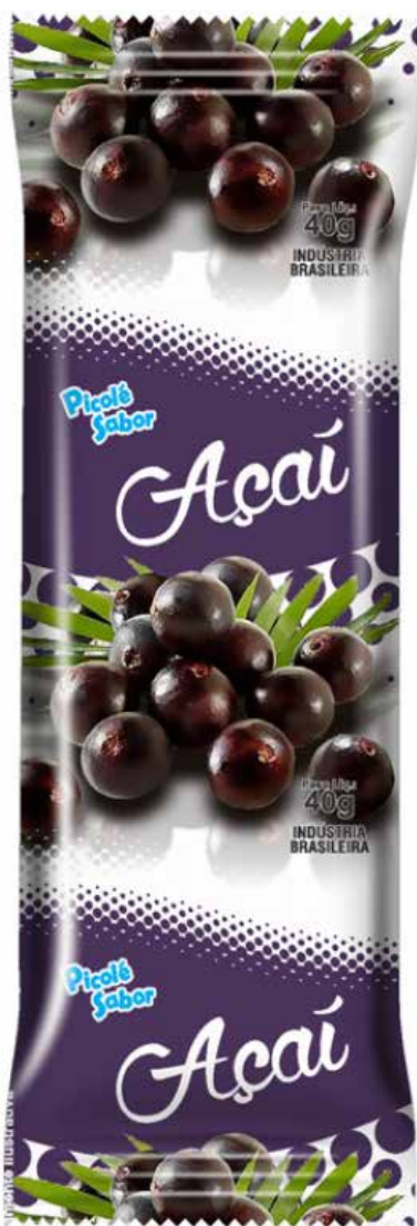
ÇAÍ cód 59