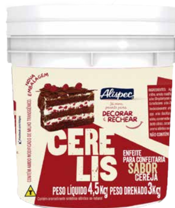
CERELIS BD 4,5 KG ..... cód 32 2,5 KG ..... cód 142