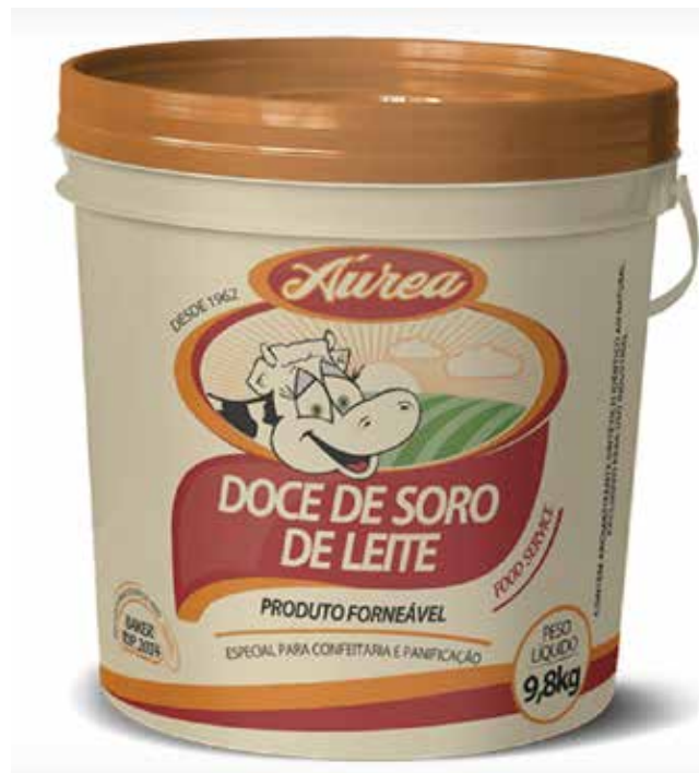
DOCE DE SORO DE LEITE TRADICIONAL 4,8 KG cód 09