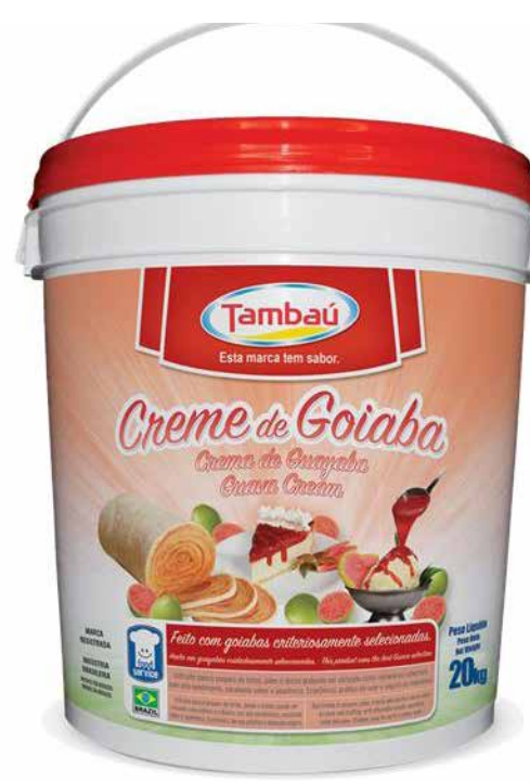
CREME DE GOIABA 4,8 KG cód 97