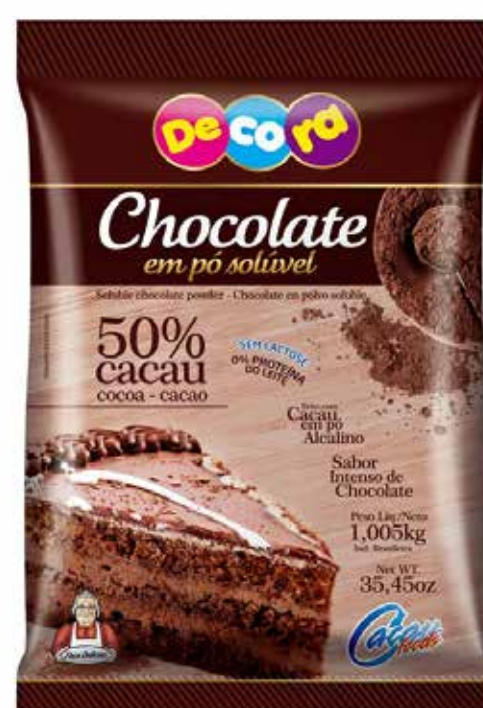
CHOCOLATE EM PÓ SOLÚVEL 50% CACAU cód 124