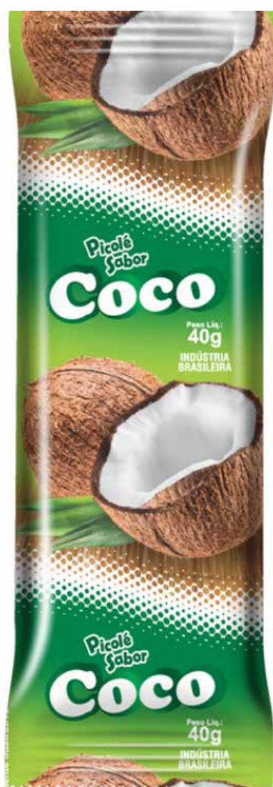
COCO cód 63