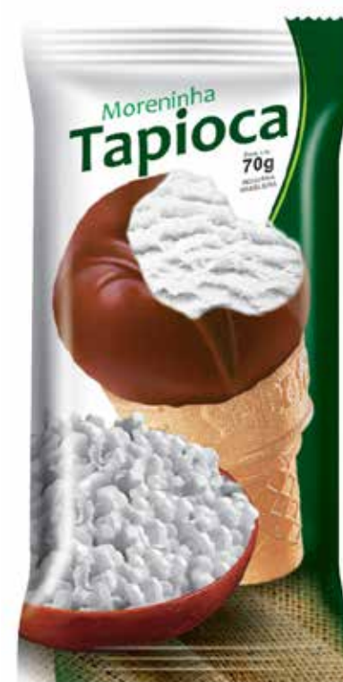
FLOCOS cód 78