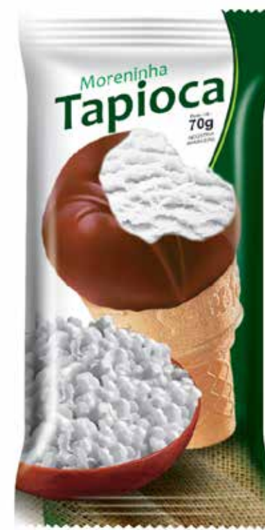
TAPIOCA cód 80