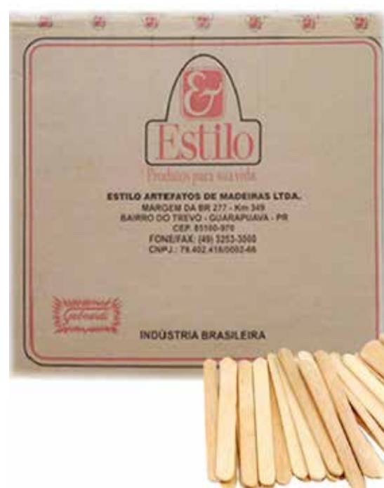
COMUM PONTA REDONDA cód 11