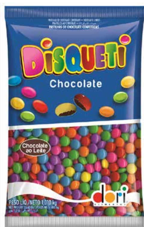
DISQUETE CHOCOLATE 1,010 KG cód 95