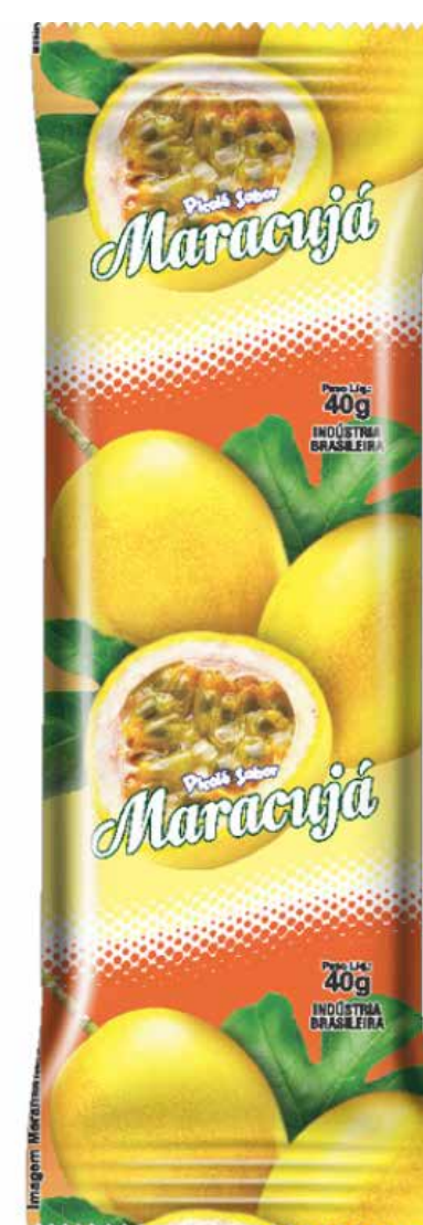
MARACUJÁ cód 69