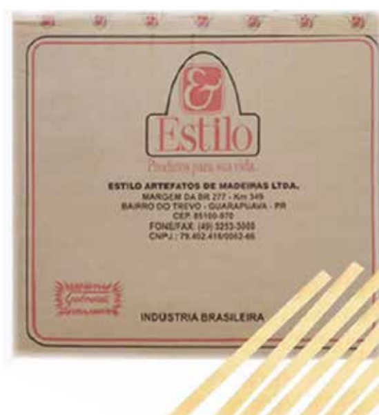
COMUM PONTA QUADRADA cód 10