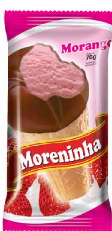
MORANGO cód 75