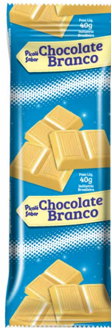
CHOC. BRANCO cód 64