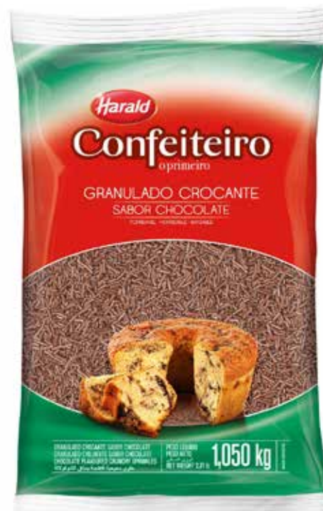
GRANULADO CROCANTE ESC HARALD 1,050 KG cód 121