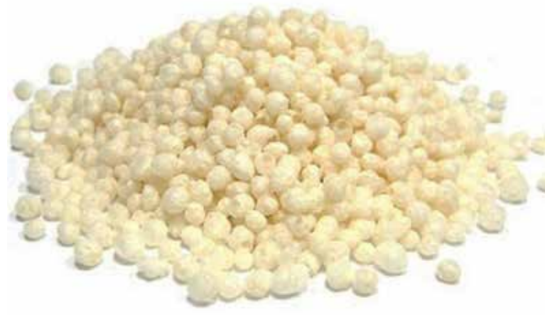
FLOCOS DE ARROZ A GRANEL cód 110