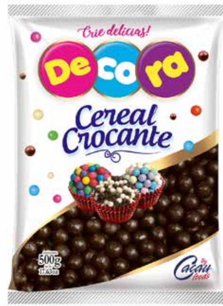
BIG CEREAL CROCANTE CHOCOLATE 500 G cód 123