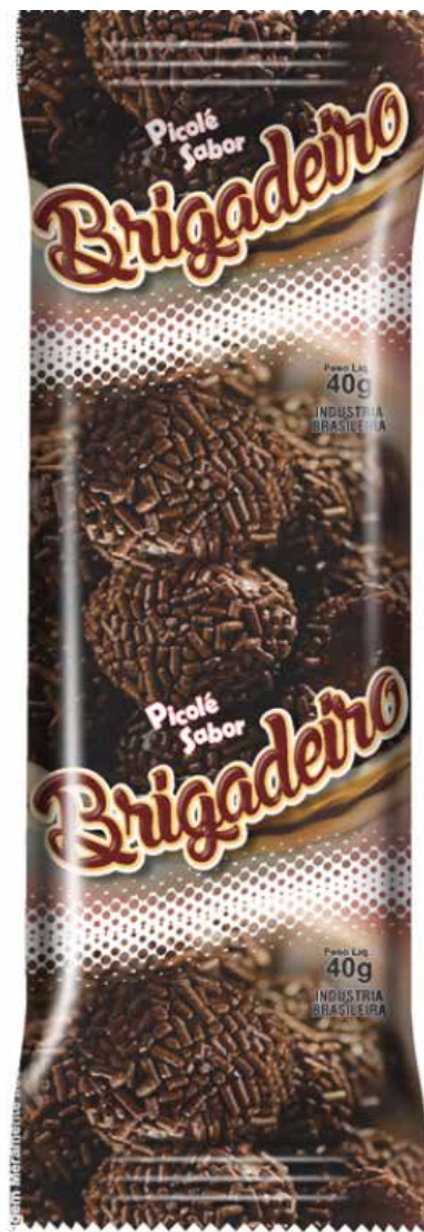
BRIGADEIRO cód 60