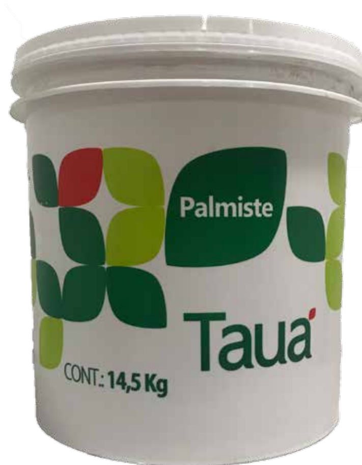
OLEO DE PALMISTE REFINADO BALDE cód 117