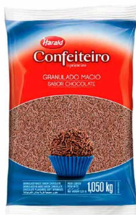
GRANULADO MACIO ESC HARALD 1,050 KG cód 14