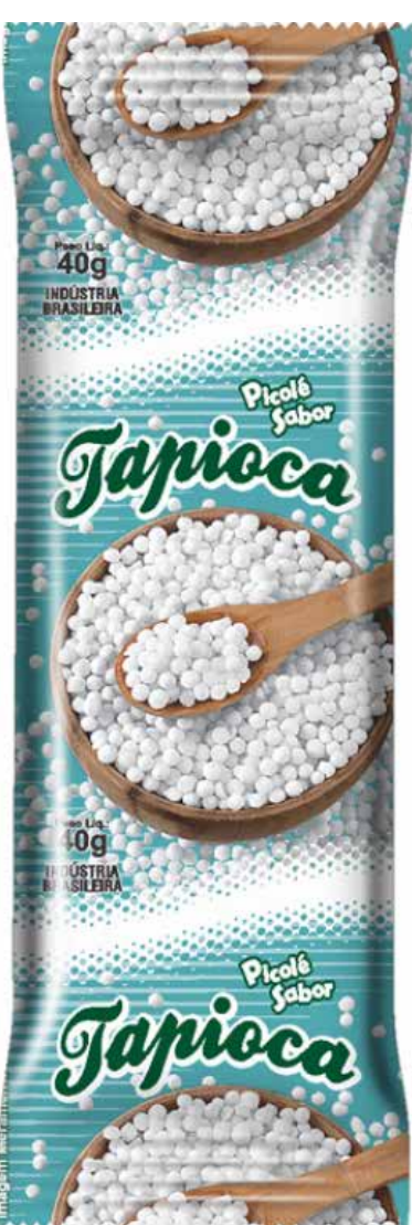
TAPIOCA cód 71