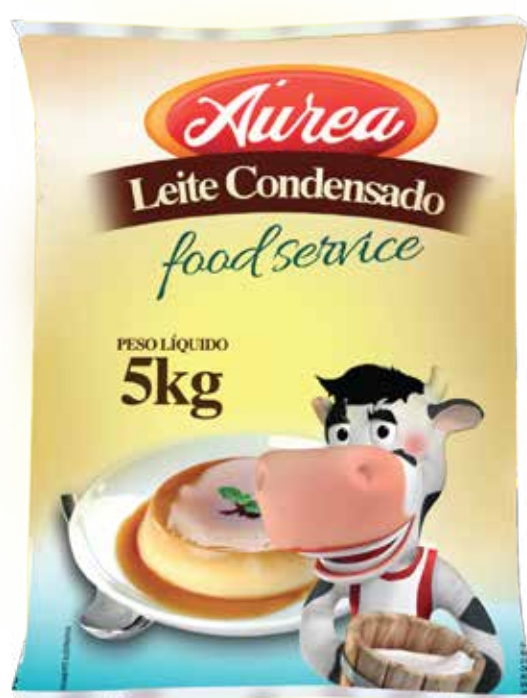
LEITE CONDENSADO 5 KG cód 35