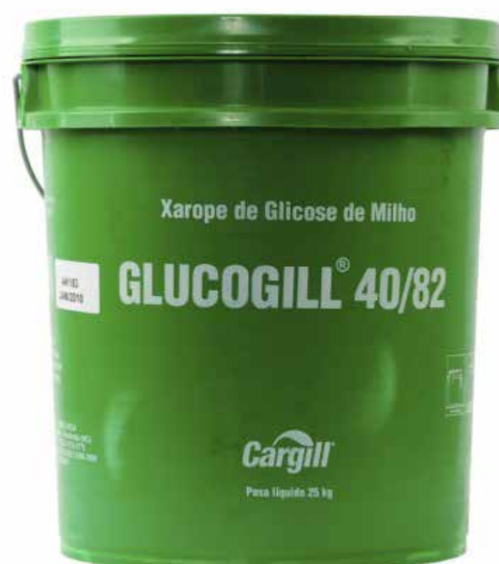
GLUCOGILL 40/82 25 KG cód 34