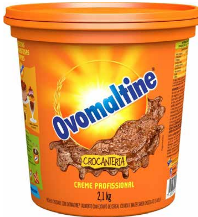
OVOMALTINE CREME CROCANTE 2,10 KG