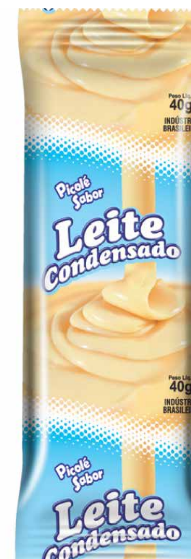
LEITE COND. cód 68