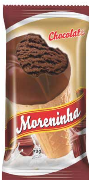
CHOCOLATE cód 74