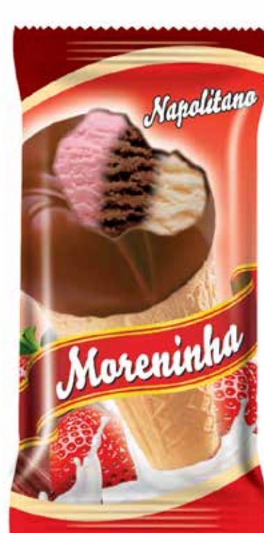
NAPOLITANO cód 79