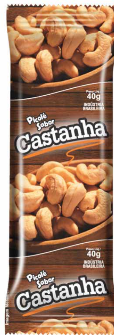
CASTANHA cód 62