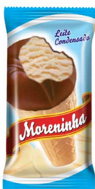
LEITE CONDENSADO cód 77