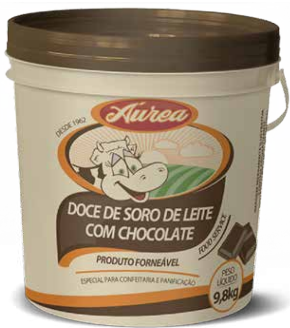
DOCE DE SORO DE LEITE COM CHOC. 9,8KG cód 04