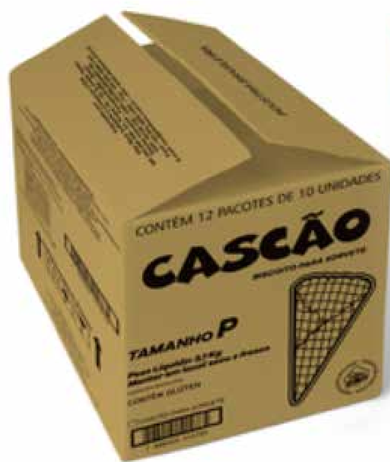
CASCÃO PEQUENO CX 120 UND cód 139