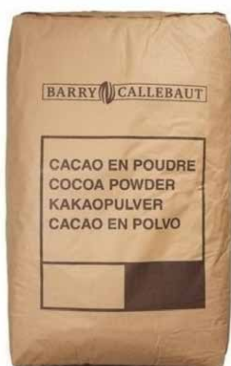
CACAU EM PÓ ALCALINO BARRY 25 KG cód 05