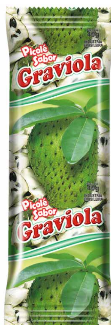
GRAVIOLA cód 67