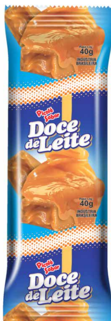
DOCE DE LEITE cód 65