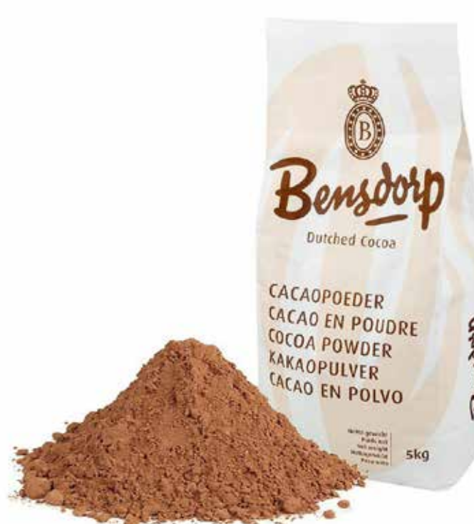
CACAU PROCESSADO BENS DORP BARRY 5 KG cód 125