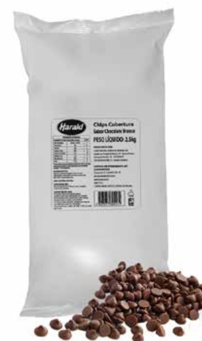
COBERTURA CHIPSHOW CHOCOLATE AO LEITE 2,5 KG cód 06