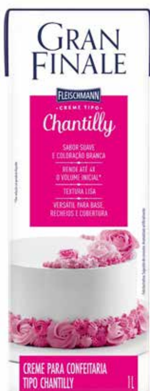
CREME DE CHANTILLY cód 144