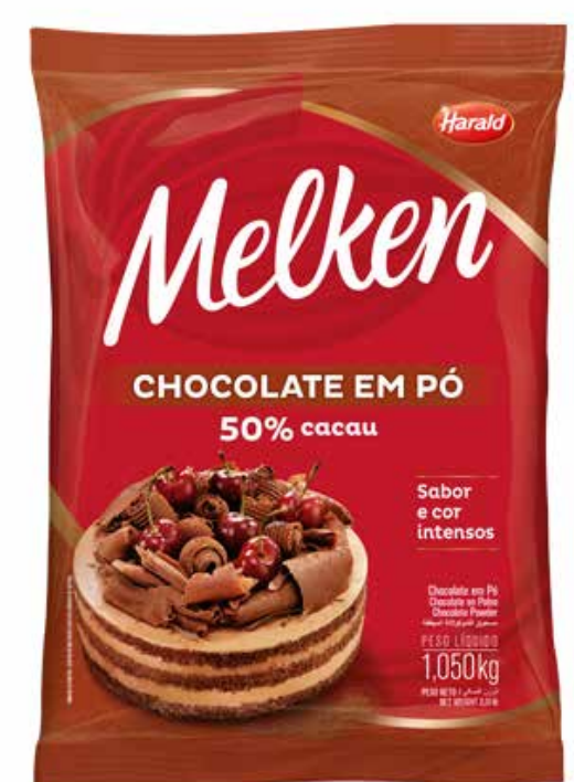
CHOCOLATE EM PÓ MELKEN 50% 1,050 KG cód 15